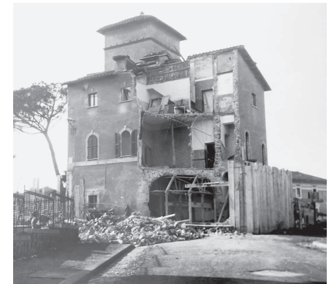
La Torretta bombardata, 1943.