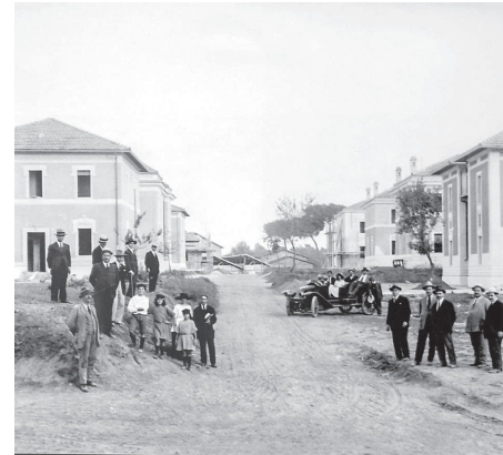
I villini in costruzione, 1920-23.