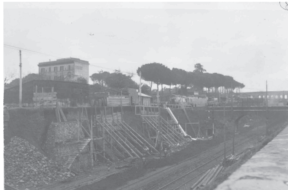
Censimento fotografico delle baracche 1938. XVI Spqr Ufficio Studi. Circonvallazione Casilina. Fronte Pigneto.

Negli anni Trenta la costruzione dei villini era conclusa da tempo e con essa la sensazione di una Roma fuori Roma che resiste tutt'ora. Quegli anni videro anche la realizzazione dei grandi edifici ordinati da Mussolini, nel tentativo di arginare il malcontento sociale in zone ritenute pericolose perché marcatamente antifasciste. Sono i palazzoni di via Montecuccoli, Romanello da Forlì e Conte di Carmagnola, venuti su velocemente, senza balconi ma con una certa attenzione alle esigenze primarie degli abitanti. Quei complessi ne richiamarono altri, assegnati dopo accurata selezione e costantemente monitorati dal Governo. Erano edifici dignitosi, ma quelli sulla Prenestina sarebbero stati deturpati tra gli anni Sessanta e i Settanta dalla costruzione della tangenziale Est.