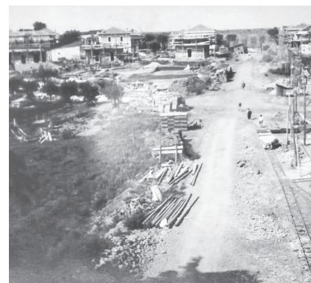
I villini in costruzione, via di Villa Serventi, 1920-23 (per gentile concessione della Cooperativa Termini).