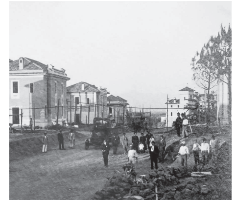
I villini in costruzione, via di Villa Serventi, 1920-23 (per gentile concessione della Cooperativa Termini).