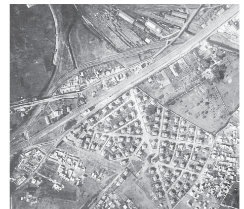
Veduta aerea dei villini, ca. 1950 (per gentile concessione della Cooperativa Termini).