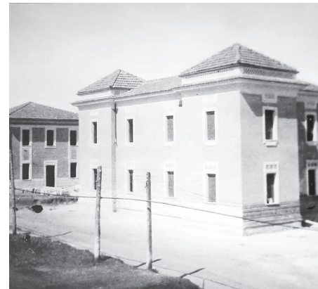
I villini in costruzione, 1920-23.