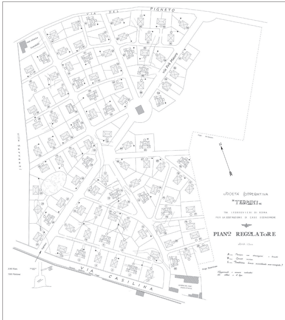
Società cooperativa “Termini”, Piano regolatore, 1931, fonte Società cooperativa Termini, elaborazione grafica di Mauro Clementi (per gentile concessione della Cooperativa Termini).

più antico della città a essere ancora in funzione – oltre ai tram e agli autobus che scorrono lungo il perimetro alberato della Prenestina costituiscono un elemento imprescindibile dell'identità pignetina. E forse è per questo che il progetto del 2007 di smantellare il deposito e restituire lo spazio al quartiere è naufragato. Si trattava del concorso di architettura bandito dal Comune di Roma dal titolo “Rimesse in Gioco. Depositi di Idee”, che raccolse molte proposte e un certo fermento e vide la premiazione di tre progetti. Ma poi non se ne fece nulla, probabilmente per ragioni tecniche, ma ci piace pensare che quell'area, così storicamente avvinghiata al quartiere, preferisca non essere toccata.