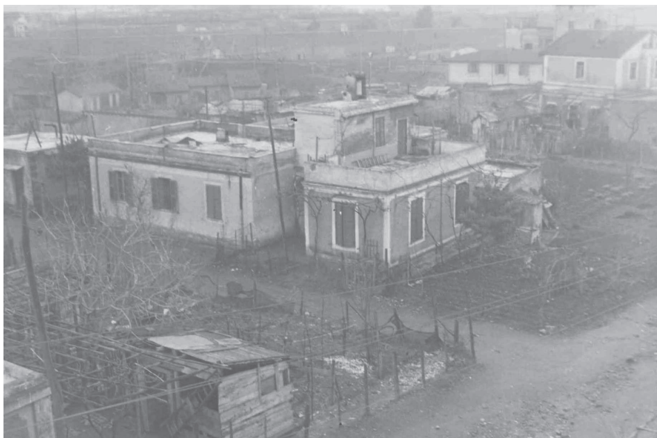
Censimento fotografico delle baracche, 1938. XVI Spqr Ufficio Studi. Pigneto.

La ragione di tanta negligenza di un tempo potrebbe essere dedotta dall'immagine che si aveva del quartiere all'epoca, come ce la descrive Guglielmo Ceroni che, nel suo Roma, nei suoi quartieri e nel suo suburbio del 1942 – citato da Carmelo Severino – racconta di quando il Pigneto non aveva "una storia ben decisa che non sia quella piuttosto banale dell'esser nato per il minor costo delle aree, siccome oltre al suo aspetto di quartiere camaleonte non presenta gran che di speciale: è periferia, vera periferia nel senso più piatto della parola, ma non per questo a chi ama Roma meno caro".