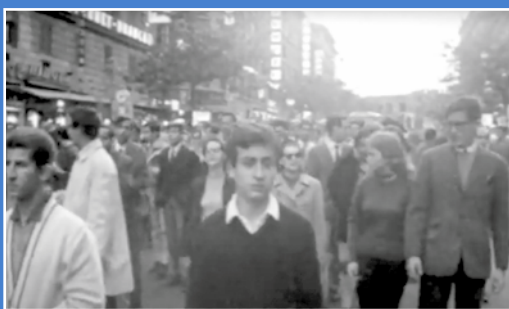
Manifestazione contro la guerra nel Vietnam davanti all'ambasciata Usa, Roma 1968

delle istituzioni “nemiche”. Pur continuando a frequentare Emma – è la sua amica, le vuole bene, si sono sempre sostenute a vicenda –, e i compagni come Marco e Pierluigi che portano avanti questa linea estremista, Luisa è sempre più distante dalle loro scelte. Ma non bisogna pensare che, nel ricostruire il passato, Luisa faccia sconti a se stessa: con abilità e grande finezza interpretativa la scrittrice la guida verso un percorso accidentato che richiede un impegnativo investimento emozionale e riflessivo.